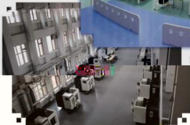
DMG 数控技术训练场所