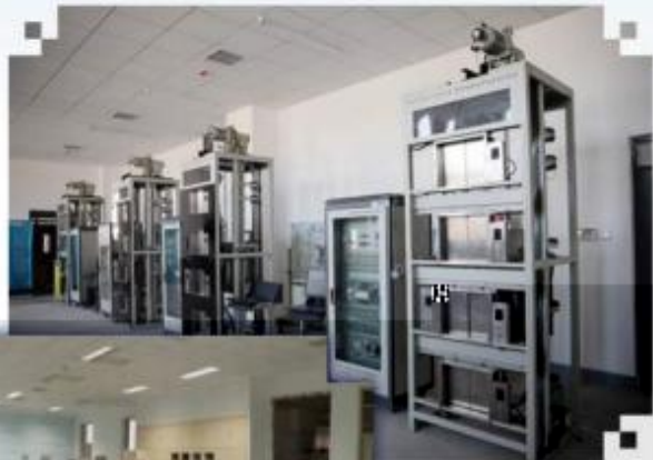
智能电梯安装调试维护训练场所